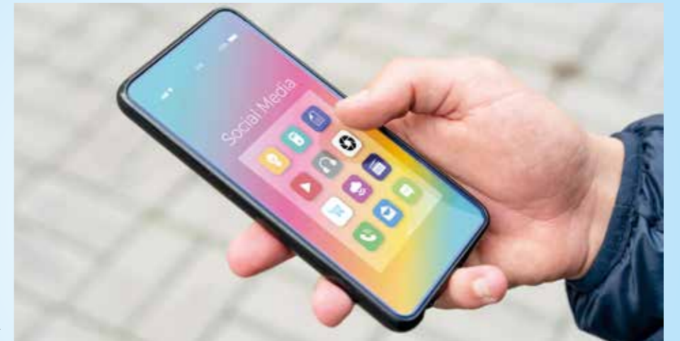
A kép illusztráció.

A mobilszközök (okostelefonok, táblagépek) megkönnyítik mindennapjainkat. Mivel nem csak otthon vagy munkahelyünkön használjuk, nagyobb a kockázata, hogy illetéktelen kezekbe kerülnek. Bizalmas és személyes adatokat tárolunk rajtuk, ezért elvesztésük vagy ellopásuk esetén az illetéktelen személyek hozzáférhetnek az eszközön tárolt adatainkhoz. Ennek megelőzésére a legegyszerűbb, ha alkalmazza az automatikus képernyőzárat.