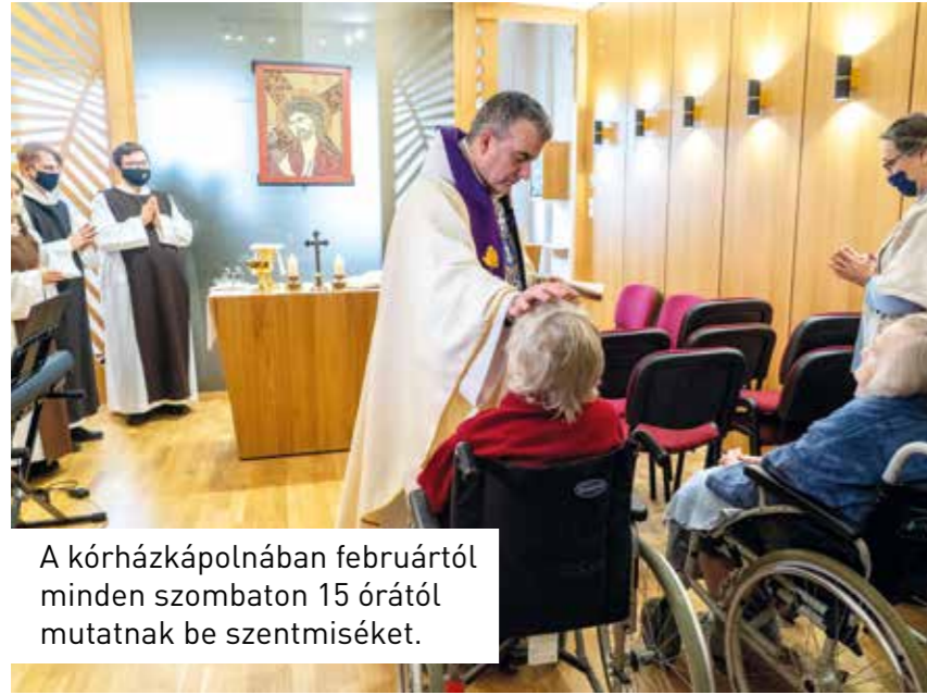
A kórházkápolnában februártól minden szombaton 15 órától mutatnak be szentmiséket.