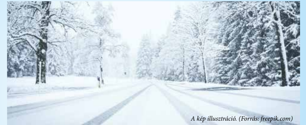
A kép illusztráció.

A közúti közlekedés jellemző időszakos veszélyei a csúszós, jeges utak, a változó időjárási körülmények, a hőtörzslaszok, elzárt útvonalak, a csökkent látótávolság, valamint a kényszermegállások. Felhívjuk a közlekedők figyelmét, hogy mindig az időjárási, látási és útvizonyoknak megfelelően vezessék gépjárműveiket, különös tekintettel az esetleges ködös, esős, havas időjárásra, csúszóssá vált útfelületre. Tartsanak nagyobb követési távolságot, mérsékeljék a sebességet! Sose induljanak el a járművel addig, amíg a lefagyott szélvédőt teljes mértékben meg nem tisztították!