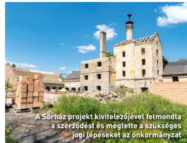
A Sörház projekt kivitelezőjével felmondták a szerződést és megtette a szükséges jogi lépéseket az önkormányzat

nyithatja meg kapuit. A sörháznál két projekt is futott, amint arról sajtótájékoztatón tájékoztatást adtunk, mindkét szerződést felmondtuk a kivitelezővel, s büntetőfeljelentést tettünk. Az építési terület átadásán a kivitelező kétszer sem