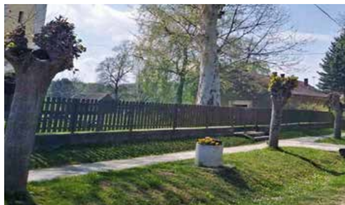
A fotón látható facsonkolás nem követendő példa

Mivel nem történt úgynevezett hajtásválogatás, odúkezelés, sebkezelés és vágásfelület-fertőtlenítés, ezért a fában lévő víz megfertőződik, és különböző gombák, baktériumok támadhatják meg a szabálytalanul lecsonkolt faegyedet. Ez a folyamat visszafordíthatatlan,