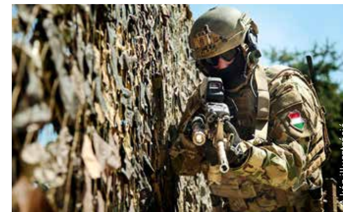
A kép illusztráció.

A felvételt nyert katonák három ciklusban végzik a hat hónapos kiképzésüket, amely alapkiképzésből, általános lövészkiképzésből és szakkiképzésből áll. Ez idő alatt bruttó 161 ezer