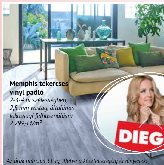
Memphis tekerces vinyl padló 2-3-4 m szélességben, 2,5 mm vastag, általános lakossági felhasználásra 2.299,-Ft/m 2