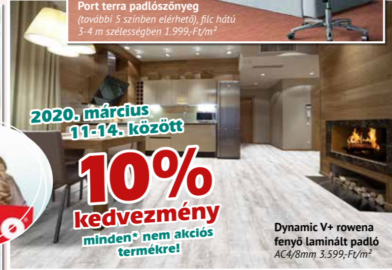
Dynamic V+ rowena fenyő laminált padló AC4/8mm 3.599,-Ft/m 2

10% kedvezmény minden* nem akciós termékre!