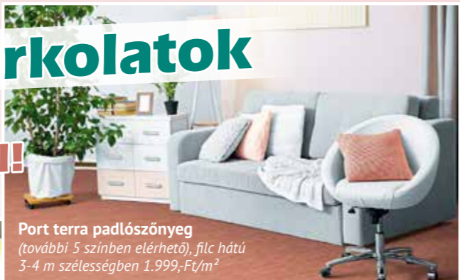
Port terra padlószőnyeg (további 5 színben elérhető), filc hátú 3-4 m szélességben 1.999,-Ft/m 2